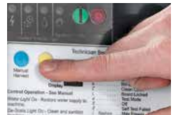
Limpeza con un toque