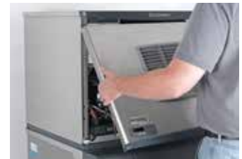
Panel frontal de alineación automática